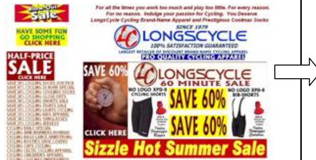
Laman web yang terlalu panjang

Selain daripada lebar laman web yang lebih daripada sepatutnya, terdapat juga laman web yang dibiarkan berpanjangan dalam satu skrin yang sama. Ini menyebabkan ianya memakan masa untuk dipersembahkan di samping menyukarkan pengguna mengesan maklumat yang diperlukan. Selain itu laman web sebegini juga memaksa pengguna bergerak dari atas ke bawah dan sebaliknya bagi mencapai maklumat yang diperlukan. Perhatikan contoh laman web yang dipaparkan berikutnya.